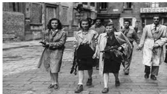
donne in strada - foto d'archivio

Il 25 Aprile 1945 è la data in cui il "Comitato di Liberazione Nazionale Alta Italia" proclamò l'insurrezione generale contro i nazifascisti che ancora occupavano i territori del nord Italia e assunse il potere "in nome del popolo italiano". Fu il presidente del Consiglio Alcide De Gasperi a proporre la ricorrenza e il 22 aprile 1946 e il Re Umberto II, allora principe e luogotenente del Regno d'Italia, emanò il decreto legislativo e n. 185 che all'articolo 1 recita: "A celebrazione della totale liberazione del territorio italiano, il 25 aprile 1946 è dichiarato festa nazionale".