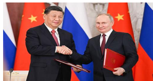
visita a Mosca di Xi-Jinping (21-22/3)