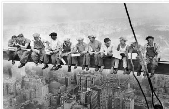
a pranzo sul grattacelo-foto storica

I numeri sono consistenti per un paese civile perché dietro ogni denuncia si nasconde un lutto o una invalidità. Un dato su tutti: nel 2022 sono stati registrati 1.090 infortuni mortali.