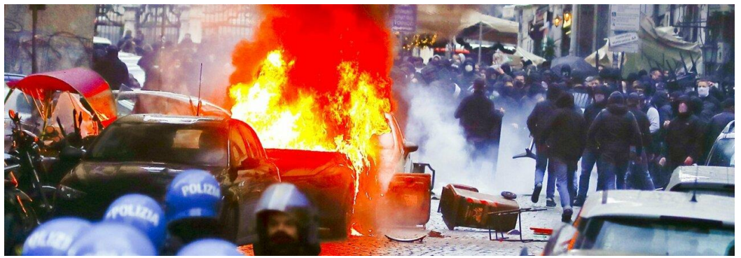
guerriglia urbana a Napoli 15 marzo 2023

Morten Torby calciatore della nazionale norvegese, si è distinto per il suo impegno nella tutela dell'ambiente. Nella stagione 2021/22 in squadra con la Sampdoria decide di cambiare il numero di maglia dal 18 al 2 per sensibilizzare i tifosi in merito all'Accordo di Parigi, stipulato tra gli Stati membri della Convenzione quadro delle Nazioni Unite sui cambiamenti climatici.