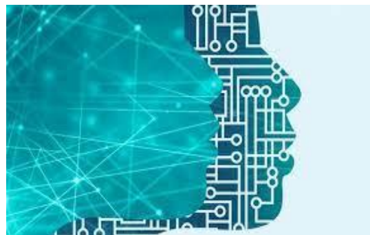
profilo di donna

"DigitALL: innovazione e tecnologia per l'uguaglianza di genere" è stato anche il filo conduttore della giornata dell'8 marzo 2023. Aumentare le competenze digitali rosa e portare sempre più donne verso la tecnologia può difatti aumentare la consapevolezza sui propri diritti civili e può contribuire a garantire una maggiore creatività e innovazione tecnologica per tutti; ed ancora, avvicinare le donne alla tecnologia vuol dire anche "risparmiare": secondo il rapporto Gender Snapshot 2022 di UN Women, l'esclusione delle donne dal mondo digitale ha sottratto 1.000 miliardi di dollari al prodotto interno lordo dei Paesi a basso e medio reddito negli ultimi dieci anni, una perdita che, in assenza di interventi, salirà a 1.500 miliardi di dollari entro il 2025.